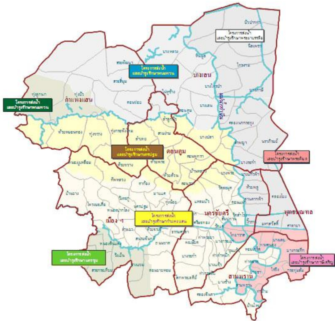
รูปที่ 2.2 โครงการชลประทานจังหวัดนครปฐม